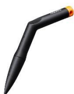
Pikownik Solid™ ok. 30 zł