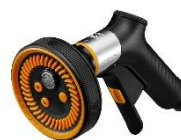
Pistolet zraszający, multi FiberComp™ ok. 165 zł