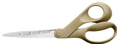
Nożyczki ogrodowe ReNew 21 cm ok. 80 zł